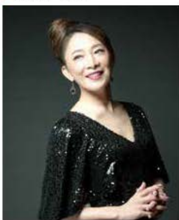
香寿 たつき [横浜～江差] 女優

元宝塚歌劇団星組トップスター。「エリザベト」「ロミオとジュリエット」「モーツァルト」などに出演。菊田一夫演劇賞受賞。