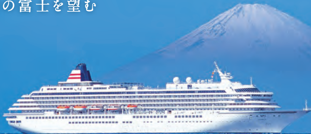
富士山と飛鳥II イメージ