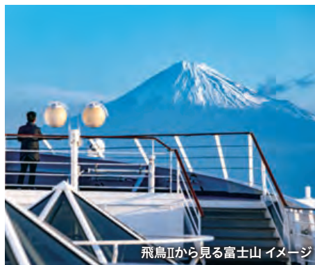
飛鳥IIから見る富士山 イメージ

駿河湾から望む富士山は遮るものがなく、天気によっては稜線まで、その美しい姿を見せてくれます。景色の中に幻想的に浮かび上がる、洋上ならではの絶景を船上の“特等席”でたっぷりとご堪能ください。