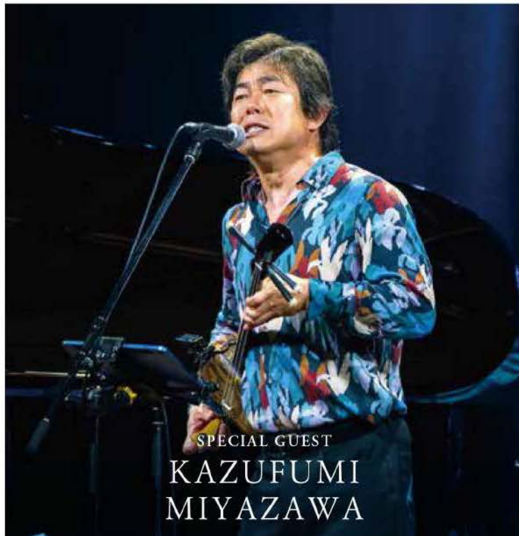
SPECIAL GUEST KAZUFUMI MIYAZAWA