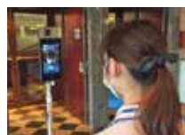
サーマルカメラによる検温