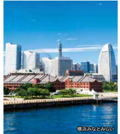
横浜みなとみらい