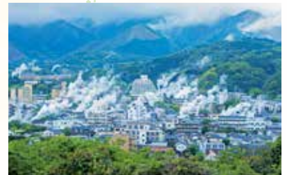
VIEW POINT 湯けむりに霞む街並み

終日航海日の夜には飛鳥クルーズ就航30周年を記念した特別なメニューをご用意します。