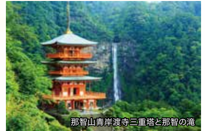
那智山青岸渡寺三重塔と那智の滝