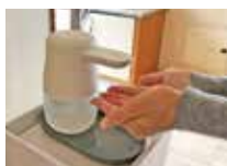
アルコールによる手指消毒

船内各所に手指消毒用アルコールをご用意しますので積極的にご利用ください。また、サーマルカメラを設置しお客様の体温を計測します。