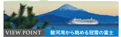
VIEW POINT 駿河湾から眺める冠雪の富士

アスカクラブ会員様は旅行代金が 10%割引 になります。ご予約の際にアスカクラブ会員である旨を旅行会社へお伝えいただき、割引券をご提出ください。※Sロイヤルスイートを除く。