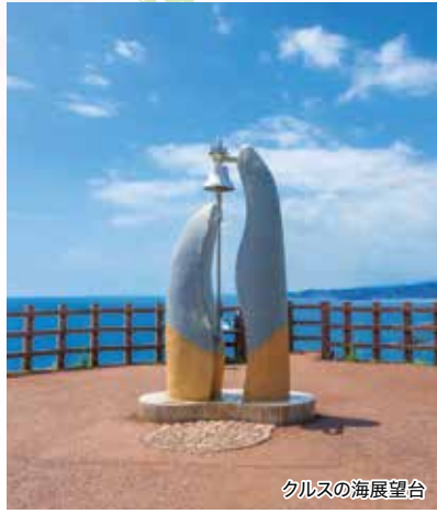
クルスの海展望台

CRUISE POINT クルーズポイント 春の週末を利用した神戸発着のクルーズです。コンパクトな日程ながら、クルーズライフも寄港地観光も両方お楽しみいただけます。