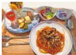
昼食イメージ 洋食セット