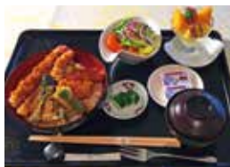
昼食イメージ 和食セット

旬の食材や寄港地の特産を大切に、飛鳥Ⅱのバラエティ豊かなメニューはクルーズライフをより至福のひとつへと誘います。夕食は、フランス料理を中心としたコース料理を、朝食・昼食は、和食と洋食からお選びいただけます。総料理長がよりこだわりをみせるアニバーサリーディナーや春の日ディナーにもご注目ください。